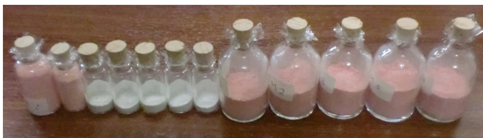
Prototipe Bedak Obat - Zeolit-Cu

Medicated Powder dengan campuran zat aditif aktif (zeolite-Cu), komposisi utama Talk, Kaolin dan MgCO_3 . dan aditif pasif (rasa, aroma dan warna) terbukti mampu menghambat pertumbuhan mikroba pathogen. Inovasi ini dapat menjadi alternatif obat khususnya bedak obat yang berbasis pada serat alam dengan sumber daya lokal sehingga dapat lebih terjangkau secara ekonomis dengan kualitas yang sama baiknya dengan bedak obat di pasaran dengan bahan aditif aktif impor.