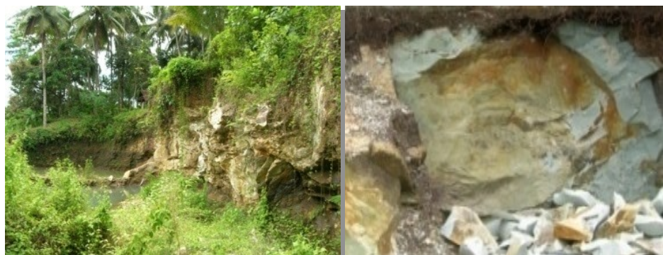
Sampling Zeolit Alam daerah Cikancra

Bedak Obat (Medicated Powder) ini berbahan dasar dari silika alam, yaitu zeolit. Bahan dasar zeolit menjadi bahan aktif zeolit-Cu melalui proses kalsinasi dan impregnasi serta perekayasaan lainnya terhadap mineral yang bersangkutan.